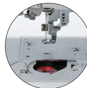
Canette à fixation rapide et détecteur de canette