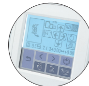
Écran ACL tactile à rétroéclairage