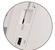
Effectuez le transfert de motifs à partir d'un dispositif mémoire USB