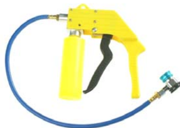
A0KL005V Injecteur industriel