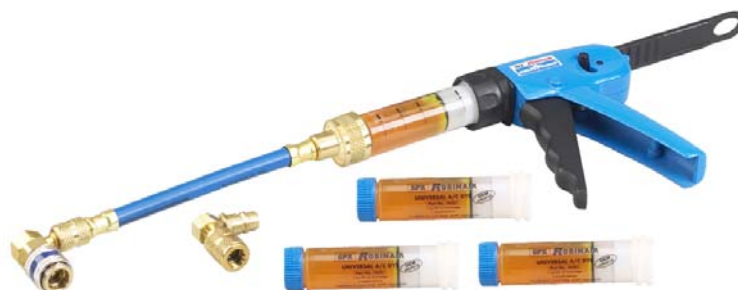
A0KL004V Injecteur traceur UC