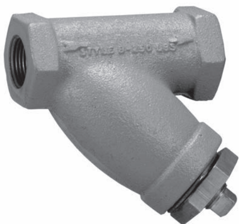
Figure 1. Filtre 262K classique de Fisher

Ce filtre contient un élément filtrant en cellulose imprégnée de résine capable d'intercepter des particules de 40 microns.