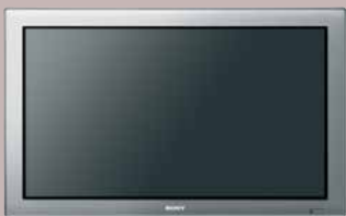
PLATEADO CON RECUBRIMIENTO ACRÍLICO