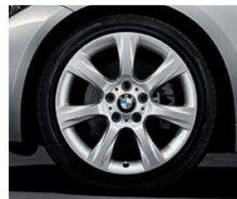
Rines con diseño de radios en estrella estilo 396 de 18". Opcional en todas las versiones.