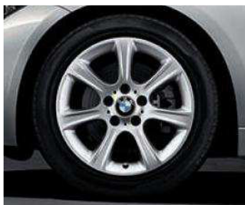
Rines con diseño de radios en estrella estilo 394 de 17". De serie en el BMW 320iA.