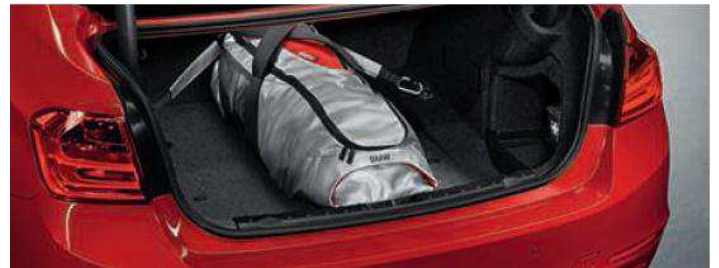
Bolsa portaobjetos en el maletero. Disponible para las versiones Sport y Modern Line. Permite la transportación segura de objetos para evitar su movimiento en el maletero.