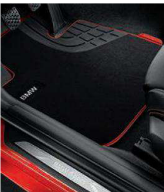
Alfombrillas de velour. Diseño único, resistentes al agua y repelentes al polvo. Disponible en diferentes versiones.