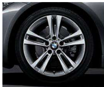
Rines con diseño de radios dobles estilo 397 de 18". Opcional en el BMW 320iA Sport Line.