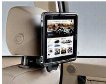
Soporte para iPad. Sujeta de manera firme un iPad en los soportes de los reposacabezas delanteros.