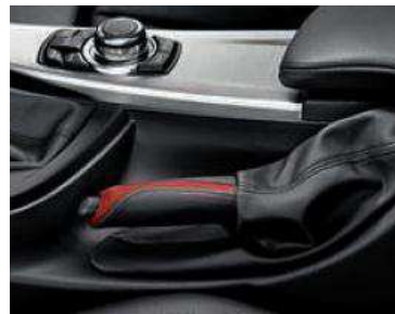
Freno de mano. Disponible para las versiones Sport y Modern Line. Agrega un detalle único al interior.