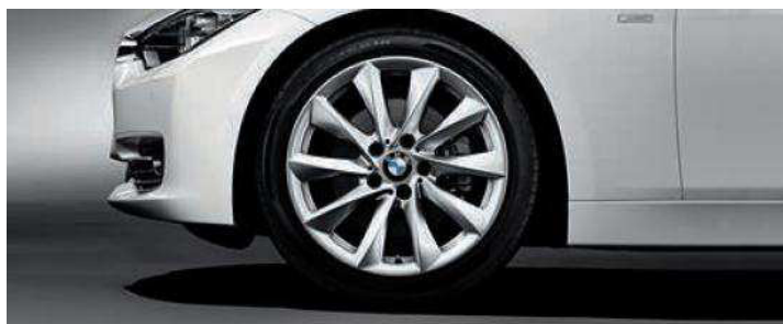
Rines con diseño de radios tipo turbina estilo 415 de 18". Opcional en el BMW 320iA Modern Line.