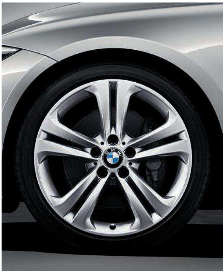
Rines con diseño de radios dobles estilo 401 de 19". Neumáticos de distintas medidas, delante 225/40, detrás 255/35 R19". Opcional en todas las versiones.