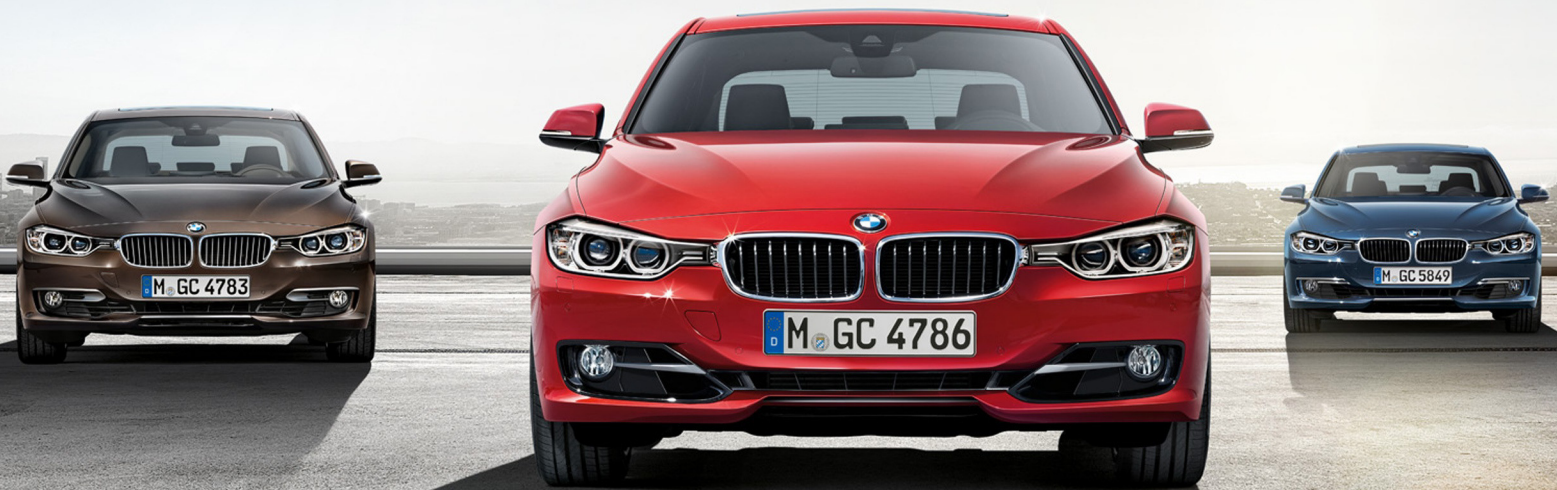
Imagen únicamente ilustrativa.