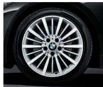
Rines con diseño de radios múltiples estilo 416 de 18". Opcional en el BMW 320iA Luxury Line.