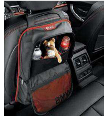
Bolsa portaobjetos trasera. Disponible para las versiones Sport y Modern Line. Permite la transportación segura de objetos para seguridad de los pasajeros.