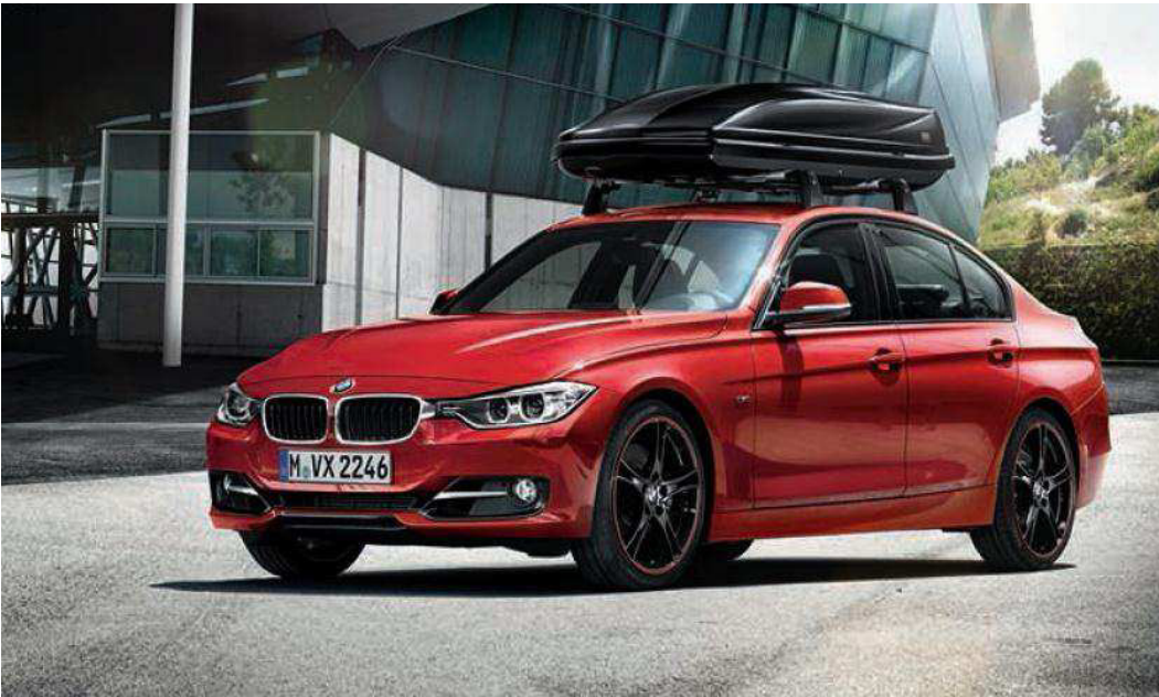
Rines con diseño de radios dobles estilo 361 de 20". En color negro con contorno rojo.