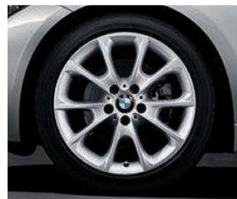
Rines con diseño de radios en V estilo 398 de 18". Opcional en todas las versiones.