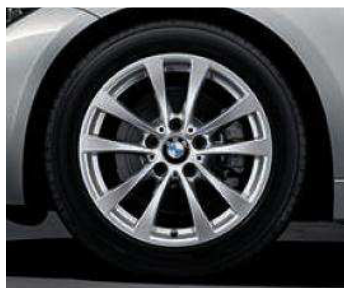
Rines con diseño de radios en V estilo 395 de 17". Opcional en todas las versiones.