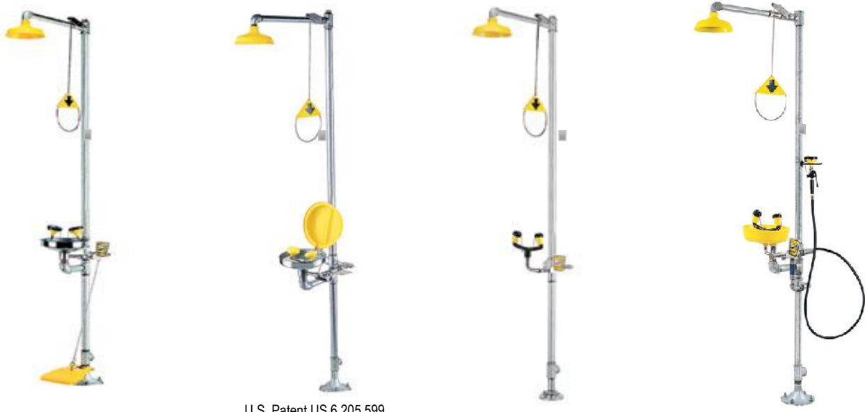
U.S. Patent US 6,205,599

Estaciones Estándar de Regadera y Lavaojos de Emergencia de acero galvanizado y acero inoxidable, incluyendo regaderas resistentes a la congelación estándar, están diseñadas para montaje en el piso en áreas en donde la gente pueda entrar en contacto con materiales peligrosos.