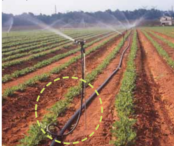
Varilla colocada siempre cerca del conector de inicio

Insertar la varilla hasta la profundidad de 40 cm. En suelos secos y rígidos, repetir la operación luego de un mojado inicial o alternativamente, emplear un martillo y una estaca de hincado de 8 mm de diámetro. Insertar la varilla con el anillo estabilizador hasta llegar al punto superior del anillo.