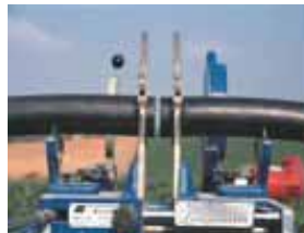
Soldador de tuberías LM2