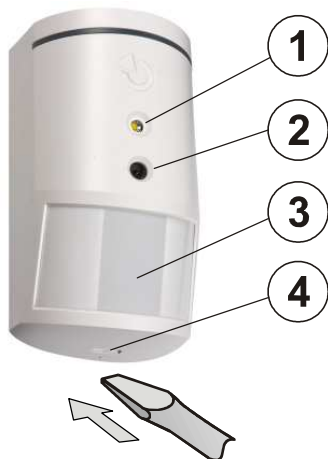
Figura: 1 - flash de cámara para iluminación adicional; 2 - objetivo de cámara; 3 - lente PIR del detector; 4 - cerrojo de la tapa;

El detector se puede montar en la pared o en el rincón de una habitación. En su campo visual no debería haber objetos que cambian rápidamente la temperatura (estufa eléctrica, aparatos de consumo eléctrico etc.), ningunos objetos que se mueven (p. ej. cortinas en movimiento encima de un radiador) ni animales domésticos. No recomendamos instalar el detector frente a las ventanas o reflectores ni en los lugares donde circula aire (ventilación, aire acondicionado, respiraderos, puertas inestancas etc.). Ante el detector no debe haber ningunos obstáculos que impidan su vista.