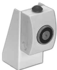
EST10 Soporte 90°