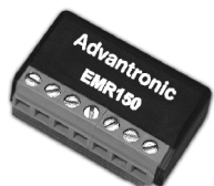
EMR150 Módulo electrónico selector de hoja