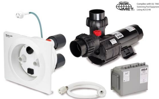
BaduJet Super-Sport Dos Jets

El sistema completo BaduJet ofrece succión y descarga en la caseta de dos jets, patentada y única de Speck Pumps. Botones para encendido y apagado así como también para el control del volumen de agua se encuentran localizados al frente de la caseta.