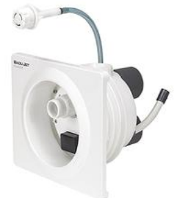
BaduJet Classic Un Jet