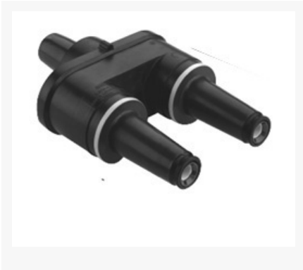
Figura 1. Adaptador tipo feed thru insert con soporte

Establecer las especificaciones técnicas que deben cumplir los adaptadores con norma IEEE standard 386 de 15 kV (tipo feed thru insert) utilizados en la conexión entre terminales tipo codo y los bujes tipo pozo en el sistema de distribución de CODENSA S.A. ESP.