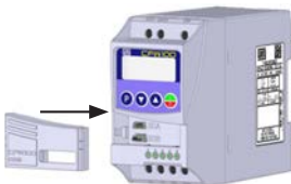
(b) Accessory connection (b) Conexión del accesorio (b) Conexão de acessório

Figure A.1 (a) to (b): Installation of accessory