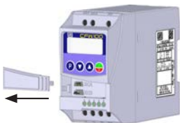
(a) Removal of front cover (a) Remoción de la tapa frontal (a) Remoção da tampa frontal