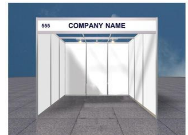
Shell Scheme Stand Sketch (For illustrative purposes only)