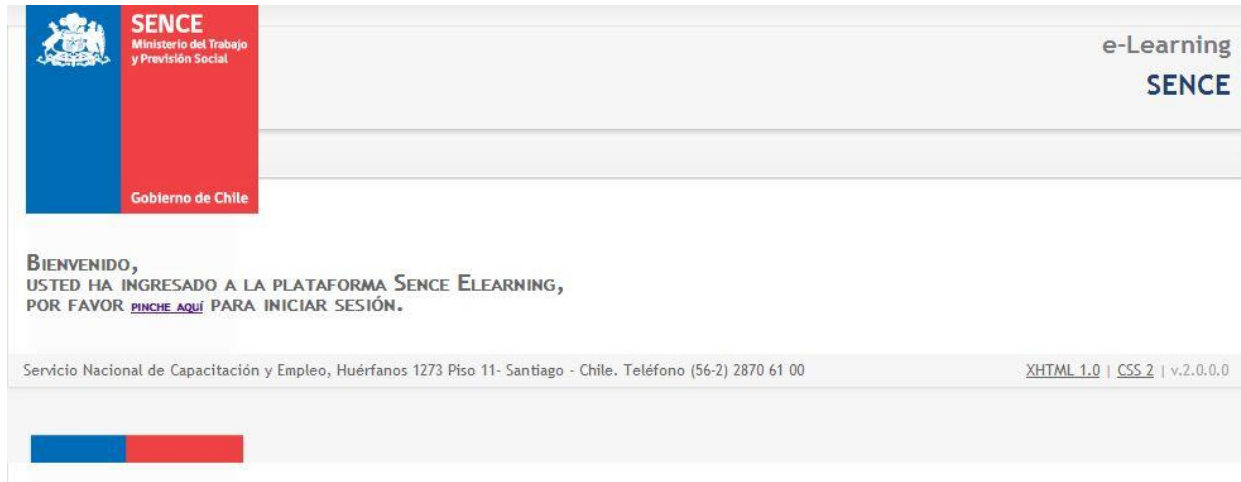
Ilustración 1: Inicio