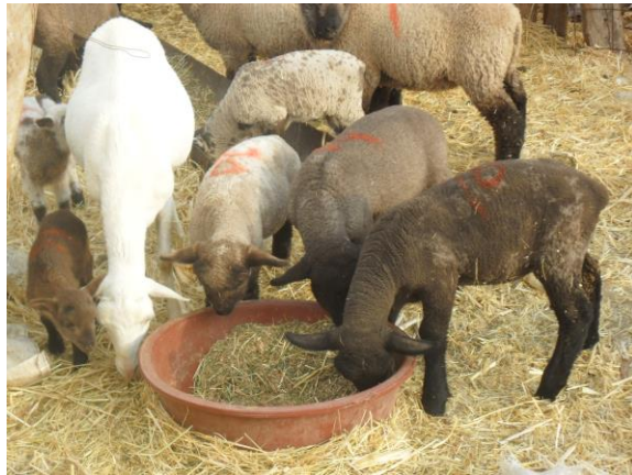
Figura 4. Corderos lactantes aprendiendo a comer, consumo del BMN