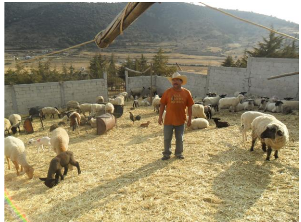
Figuras 5 y 6. Algunos de los productores cooperantes