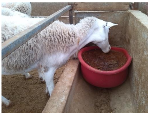
Figuras 1, 2 y 3. Ovejas en el consumo de BMN como suplemento alimenticio.