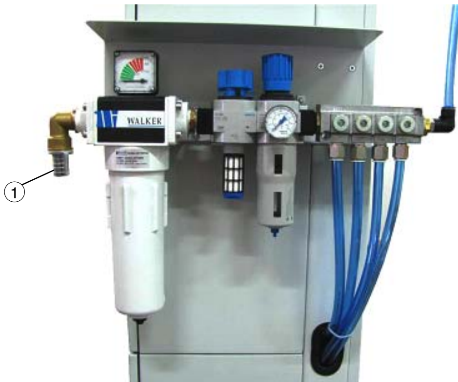
Fig. 2 Vista frontal