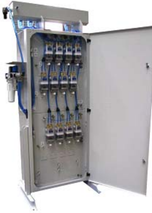
Fig. 3 Bombas Prodigy HDLV®

Para activar el ciclo de purga, pulsar el botón correspondiente en la unidad iControl.