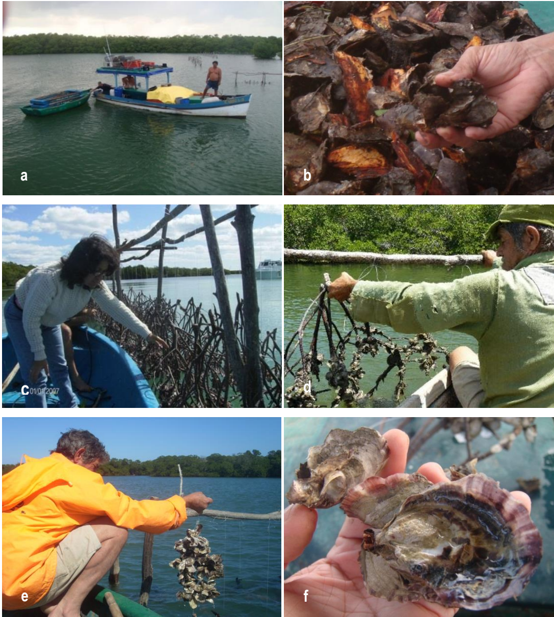
Figura 1. a) Unidad operativa pesquera en la zona de estudio, b) descortezado del mangle durante la pesca tradicional, c) granja ostrícola tradicional, d) colectores de ramas terminales de mangle, e) colectores de concha madre, y f) producto deseable: ostión individual de cultivo.

do más del 60% de los ostiones presentaron tallas \geq 20 mm, quedando sumergidos o expuestos al aire conforme al régimen de marea; (3) engorde en el mismo sustrato colector y cosecha cuando el ostión alcanzó la talla mínima legal en Cuba ( \geq 40 mm), entre 6 y 8 meses de edad (Bosch & Nikolic, 1975; Rivero-Suárez, 2012).