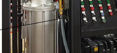
Panel de control y cámara de combustión para un generador de vapor de Kraft con interruptor de control; Detalles sobre el interruptor de control

Quiere una garantía vitalicia para su cámara de combustión? Mánden un correo a service@kraftcuring.com , Asunto: Interruptor de control para la cámara de combustión