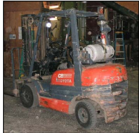
Gemelo del montacargas que retrocedió y aplastó al operador después de que éste saltó hacia afuera para ayudar a cargar un camión.

El 10 de febrero del 2004, un operador de montacargas, de 42 años de edad, fue atropellado entre el montacargas que había estado manejando y un camión que estaba ayudando a cargar. Mientras ayudaba al conductor del camión a amarrar la carga, el operador colocó el montacargas en el lado opuesto del camión, puso la transmisión automática en neutral, activó el freno de mano y saltó hacia afuera para arrojar la correa por encima de la carga hacia el conductor del camión. El motor del montacargas se dejó encendido. Mientras el operador estaba de frente al camión y ocupado con la correa, el montacargas se trabó en reversa y retrocedió hacia él, aplastándolo contra el camión con fuerza suficiente para hacer simbrar al camión. El conductor del camión se fijo bajo el remolque y vio las piernas de la víctima colgando en el aire. Corrió a poner el cambio con la palanca de velocidades del montacargas para liberar al operador. Los esfuerzos de resucitación fueron inútiles y fue declarado muerto en el lugar de los hechos.