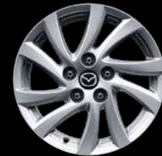
16" aleación de aluminio