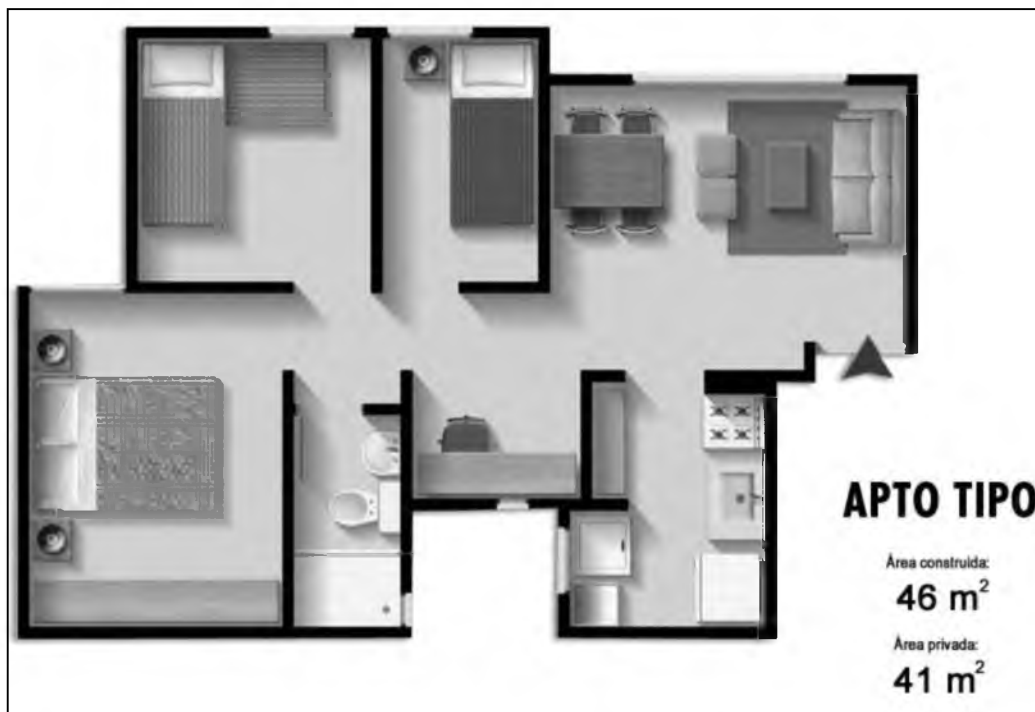
Ilustración 4. Planta apto tipo – ANTURIO II