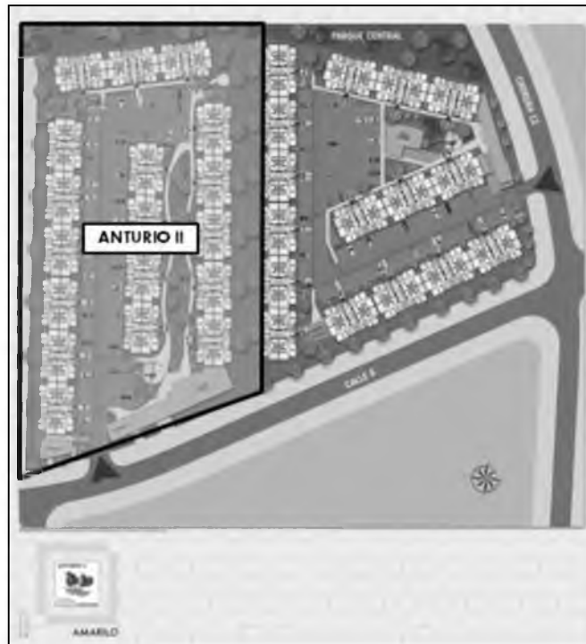
Ilustración 3. Ubicación del Proyecto

El conjunto residencial de apartamentos tipo VIS ANTURIO II que se desarrolla en la manzana 28 A del Macro proyecto de Vivienda de Interés Social y Prioritario Nacional Ciudad Verde, del Municipio de Soacha y que se encuentra delimitado al Norte con el Canal Tibanica, al Sur con la Urbanización Potrero Grande y el Plan Parcial Las Vegas al Oriente del Distrito Capital (localidad de Bosa) y al Occidente con las Haciendas la Chucua y Ogamora.