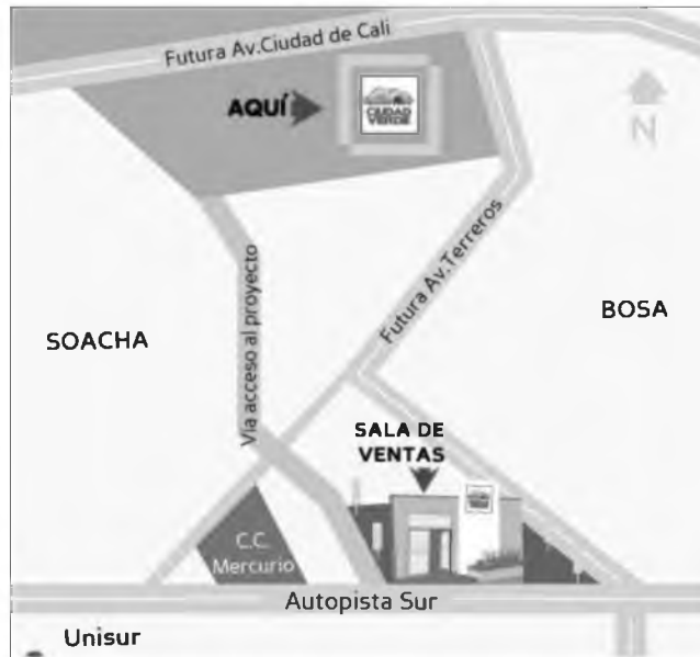
Ilustración 1. Localización General