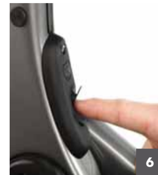
6 Cuando la batería esté totalmente cargada, retire el terminal de carga y vuelva a colocar la tapa de goma del puerto de carga