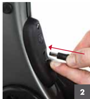
2 Mientras mantiene abierta la tapa de goma del puerto de carga, inserte el terminal de carga