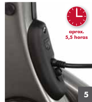
5 La carga estará completa cuando la luz del cargador pase a ser verde y los 10 LED del panel de mando parpadeen (consulte el Paso 2: C)