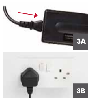
3 A) Enchufe el terminal en el cargador; B) Enchufe el cargador al suministro de corriente y actívelo (si fuera el caso)