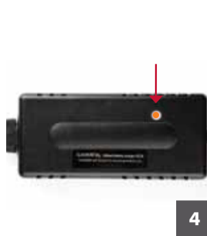
4 La luz del cargador pasará a ser naranja para indicar que se está produciendo la carga