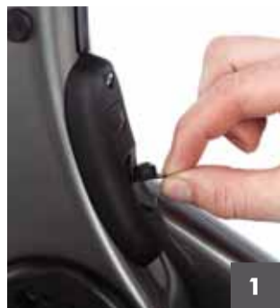
1 Abra la tapa de goma del puerto de carga