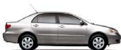
S Transmisión automática de 4 veloc. (1812) MSRP** Desde: $16,250.00