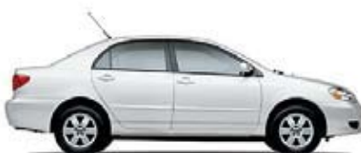
CE Transmisión automática de 4 veloc. (1802) MSRP** Desde: $15,205.00