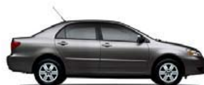
S Transmisión manual de 5 veloc. (1811) MSRP** Desde: $15,450.00