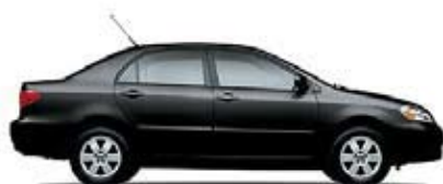
CE Transmisión manual de 5 veloc. (1801) MSRP** Desde: $14,405.00