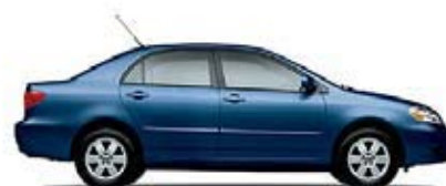
LE Transmisión automática de 4 veloc. (1822) MSRP** Desde: $16,415.00