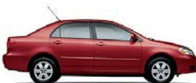
LE Transmisión manual de 5 veloc. (1821) MSRP** Desde: $15,615.00