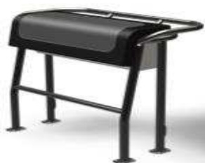
L 0,55/1 0,98/h 0,82 Z61237