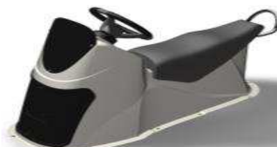
L 1,61/l 0,64/h 0,92 Z61168