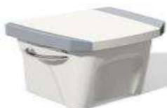
L 0,45/l 0,51/h 0,47 Z61426

Los accesorios presentados son para la gama PRO (fotos no contractuales)