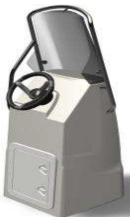
L 0,64/l 0,60/h 1,80 Z61397