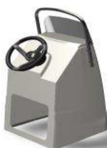
L 0,62/l 0,59/h 1,22 Z61389