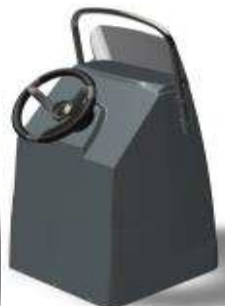
L 0,62/1 0,59/h 1,22 Z61452 FTC Con Deposito 68 L