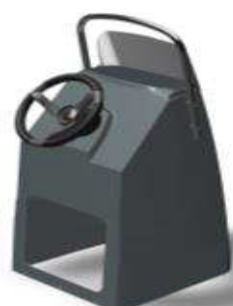
L 0,62/1 0,59/h 1,22 Z61451