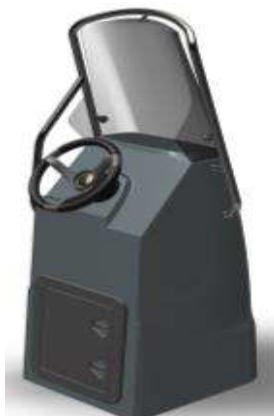
L 0,64/1 0,60/h 1,80 Z61398