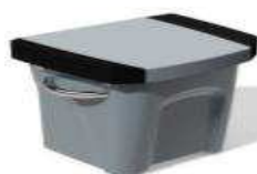
L 0,45/1 0,51/h 0,47 Z61427

Los accesorios presentados son para la gama PRO (fotos no contractuales)