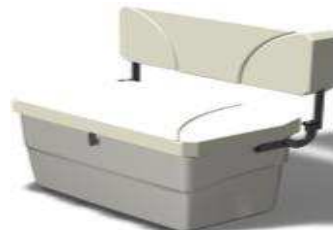
L 0,53/l 0,82/h 0,52 Z61217