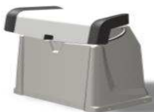
L 0,47/l 0,80/h 0,83 Z61235