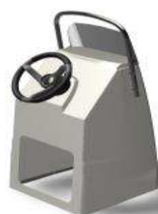
L 0,62/l 0,59/h 1,22 Z61390