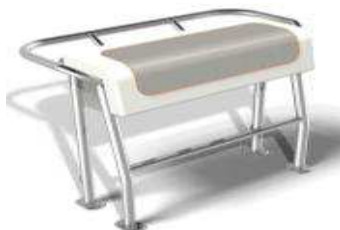
L 0,55/l 0,98/h 0,82 Z61489