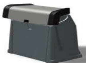
L 0,47/1 0,80/h 0,83 Z61236