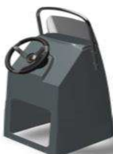
L 0,62/1 0,59/h 1,22 Z61450