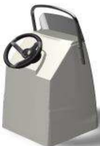
L 0,62/l 0,59/h 1,22 Z61391 FTC Con Deposito 68 L