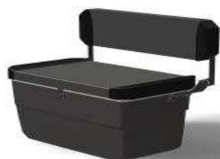
L 0,53/1 0,82/h 0,52 Z61212