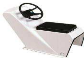
L 0,62/l 0,45/h 0,76 Z1418