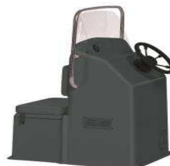
L 0,93/1 0,69/h 1,33 Z61288