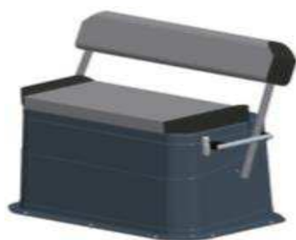
L 0,62/1 1,00/h 1,06 Z61471