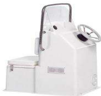
L 0,93/l 0,69/h 1,33 Z61121