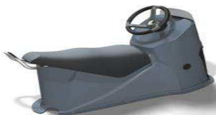
L 1,61/1 0,64/h 0,92 Z61247