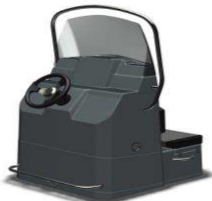
L 1,06/1 1,23/h 1,71 Z61396