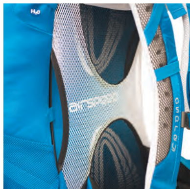
OSPREY'S AIRSPEED™ Malla transpirable tensado 3D