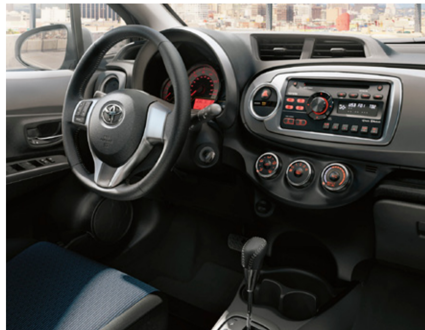
Se muestra interior del modelo SE de 5 puertas en color Dark Gray

Es un mundo muy amplio, pero no tienes por qué ponerte ansioso. A veces lo mejor que puedes hacer es cambiar tu perspectiva. Te presentamos el totalmente nuevo Toyota Yaris Liftback 2012. Es fácil describir el Yaris: Es económico, confiable y divertido. Con un gran rendimiento y millaje, está equipado con todo lo que puedes necesitar en un auto. Después de todo, el transporte es importante, pero no debería ser una gran parte de tu vida. 2012 Toyota Yaris. Avanza confiado