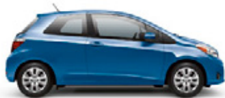
BLAZING BLUE PEARL