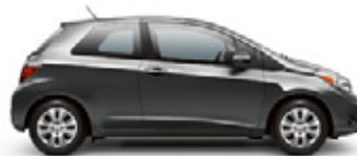
MAGNETIC GRAY METALLIC