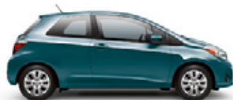
LAGOON BLUE MICA