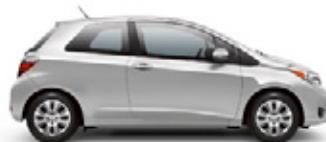
CLASSIC SILVER METALLIC