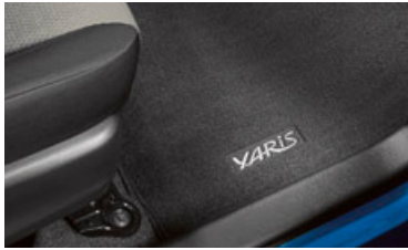
Tapetes alfombrados 18

Cenicero Espejo con atenuador automático BLU Logic ® sistema manos libres 19 Moldura lateral de la carrocería Red de carga Bolso grande de carga Tapete para el área de carga