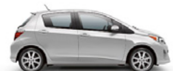
CLASSIC SILVER METALLIC