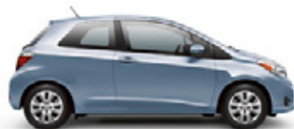
WAVE LINE PEARL