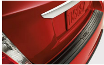
Protector del paragolpes trasero

Tapetes alfombrados 18 Protector del borde de la puerta Kit de asistencia para emergencias Kit de primeros auxilios Kit para interfaz 20 para iPod ®5 Película de protección para la pintura Protector del paragolpes trasero