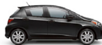
BLACK SAND PEARL