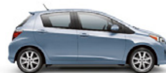
WAVE LINE PEARL