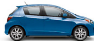
BLAZING BLUE PEARL