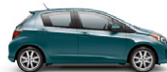
LAGOON BLUE MICA