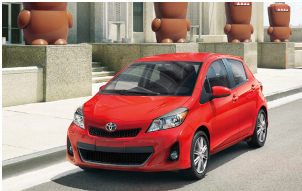
Se muestra modelo SE de 5 puertas en color Absolutely Red. Domo ©NHK-TYO; animación ©DPC, ©2007 Mimoco, Inc. Domo MIMOBOT® Series 1