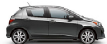
MAGNETIC GRAY METALLIC