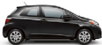
BLACK SAND PEARL