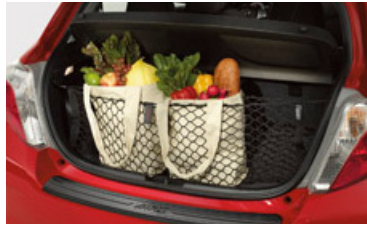
Red de carga

Cenicero Espejo con atenuador automático BLU Logic ® sistema manos libres 19 Moldura lateral de la carrocería Red de carga Bolso grande de carga Tapete para el área de carga