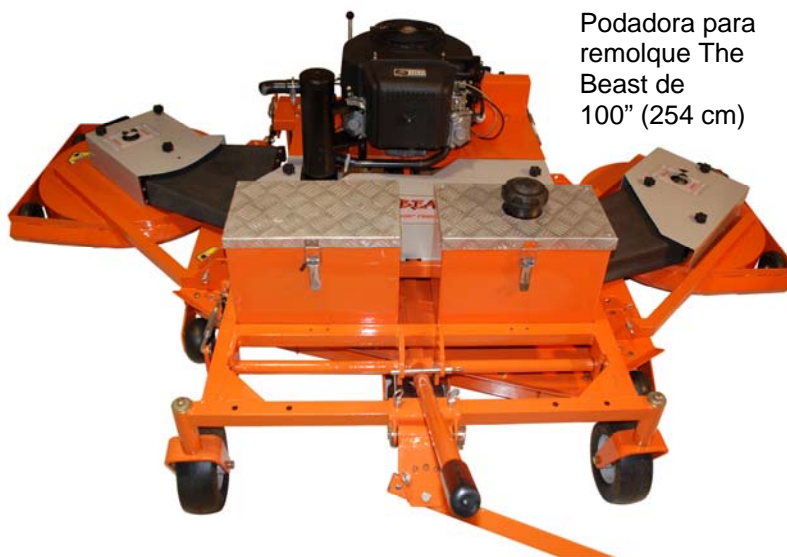
Podadora para remolque The Beast de 100" (254 cm)