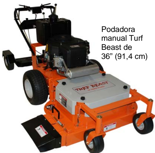
Podadora manual Turf Beast de 36" (91,4 cm)

Revise nuestros otros estupendos productos en www.HomeDepot.com o visite nuestra página en Internet www.beastpowerequipment.com