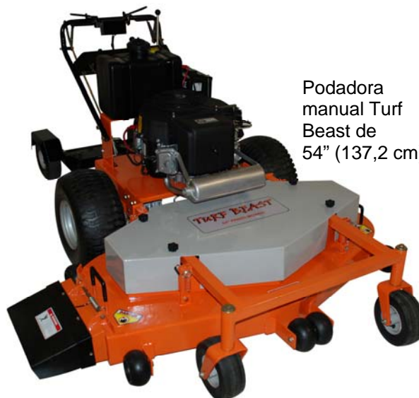
Podadora manual Turf Beast de 54" (137,2 cm)