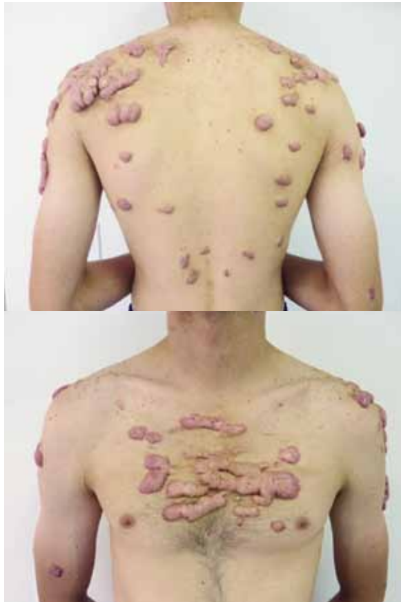
FIGURA 3-A Y B. Queloides secundarios a cicatrices por acné

que hay alteración del flujo vascular e hipoxia prolongada, se retarda el proceso de cicatrización normal. Por otro lado, se ha descrito que la hipoxia temporal en las etapas tempranas de la fase inflamatoria, favorece la cicatrización, ya que induce la producción de factores de crecimiento y citocinas 21 .