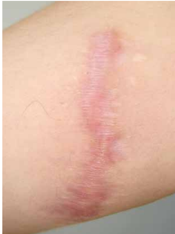
FIGURA 1. Cicatriz hipertrófica.

AUMENTO DE LA ISOFORMA 1 Y 2 DEL TGF- \beta : normalmente, el TGF- \beta induce síntesis de colágeno, fibronectina y proteoglicanos, aumenta la producción de inhibidores de colagenasas y disminuye la producción de colagenasas lo que disminuye la degradación de la matriz extracelular. Tiene tres isoformas; las isoformas 1 y 2 tienen funciones profibróticas y están aumentadas en los queloides y en las cicatrices hipertróficas. Por el contrario, la isoforma 3, cuya función es antiinflamatoria, se encuentra disminuida 12 .