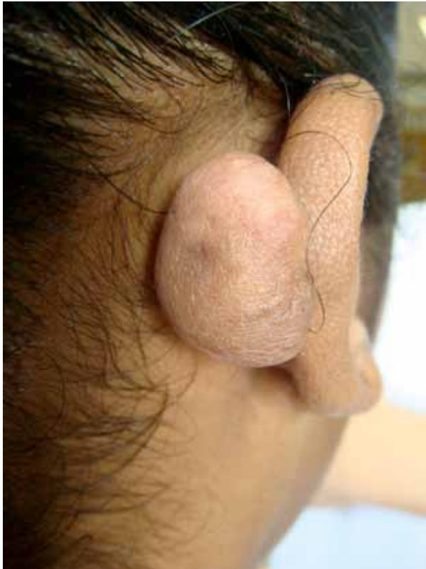
FIGURA 2. Queloides en la oreja secundario a perforación estética (piercing).

de los límites de la herida original y los bordes son regulares y eritematosos; generalmente, son asintomáticas, aunque pueden asociarse con prurito local 16 (FIGURA 1).