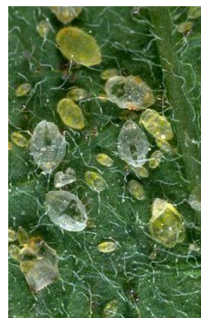
Larvas de mosca blanca