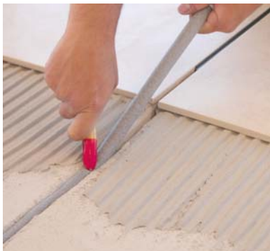
Embutir el SELLALASTIC FOAM en la junta de dilatación con una maderita.