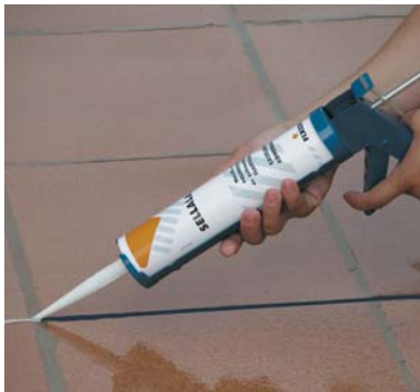
Simple aplicación con pistola universal.

Se puede pintar la junta sólo cuando ya ha secado por completo (velocidad de polimerización: 3 mm. de grosor cada 24 horas). Son recomendables las pinturas en dispersión acrílica o vinílica, previo ensayo.