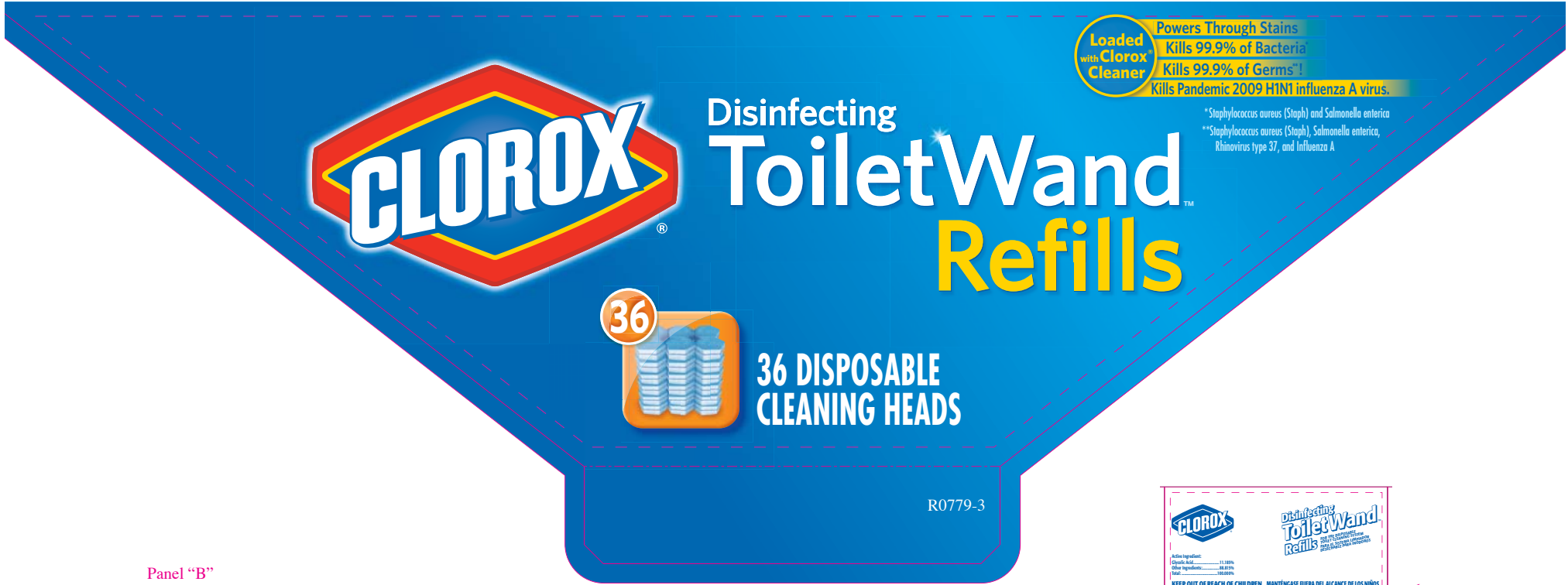
Panel "B" shown above

Top panel "B" shown at approximately 60% of actual size