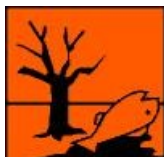
Peligroso para el Medio Ambiente N