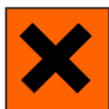
Nocivo Harmful Nocif Xn

Nocivo y Peligroso para el medio ambiente Xn y N