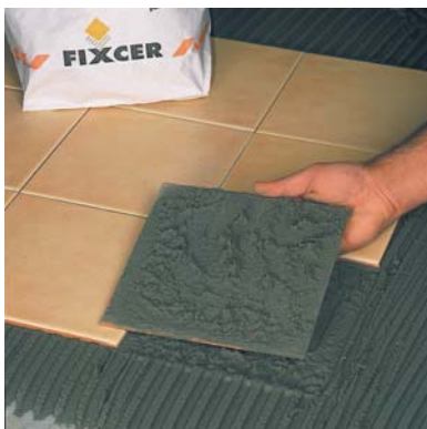
Contacto pieza-soporte del 100%