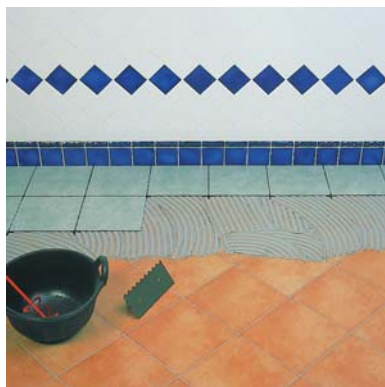
Ideal para sobreposiciones.