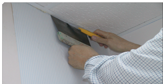
■ Corte del papel sobrante