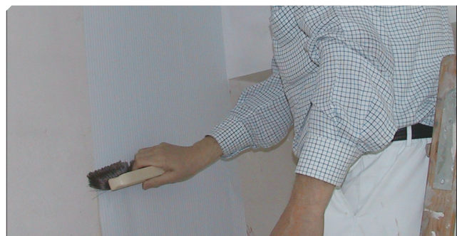
■ Alisado con cepillo para evitar la oclusión de aire