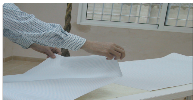
■ Doblado de las piezas de papel cortadas