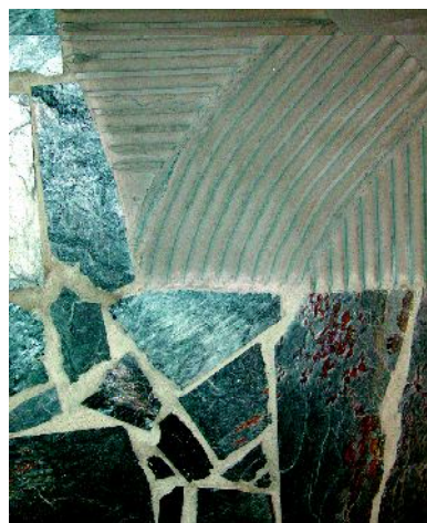
Pegado directo de piedras naturales en fachadas.

FIXAGRES FLEX CAPA GRUESA es un cemento cola, formulado a base de cemento especial, áridos de granulometría gruesa, resinas y aditivos sintéticos que, amasados con agua, dan un cemento de fácil trabajabilidad, aplicable en horizontal y vertical con grosores de hasta 25 mm sin descuelgue.