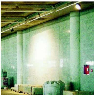
Granito en el Aeropuerto de Palma de Mallorca

• Se suministra en: Sacos de 25 Kg. en colores Gris y Blanco