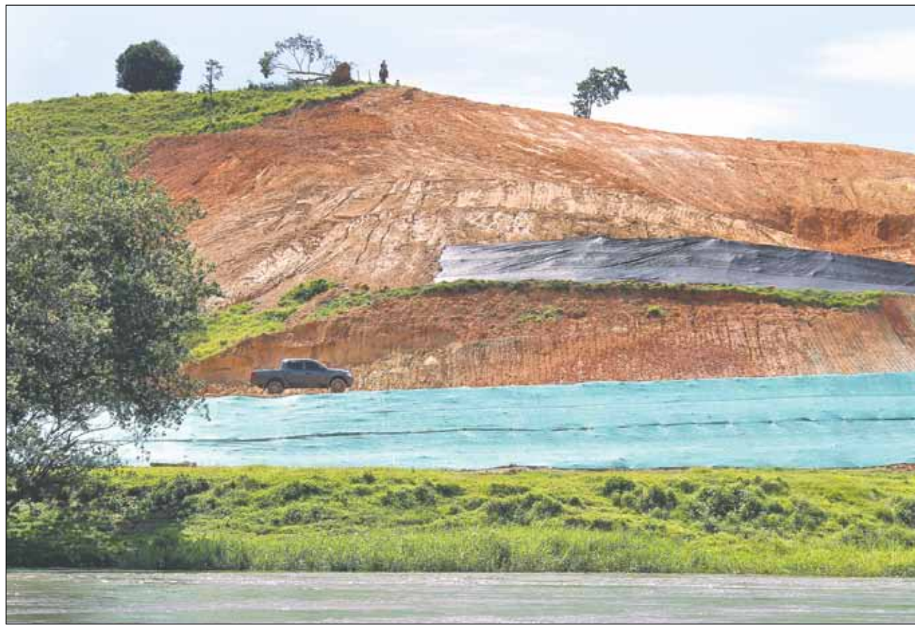
Debajo de la carretera se observa la geotela colocada para evitar la erosión y más arriba las terrazas hechas donde antes hubo bosque.