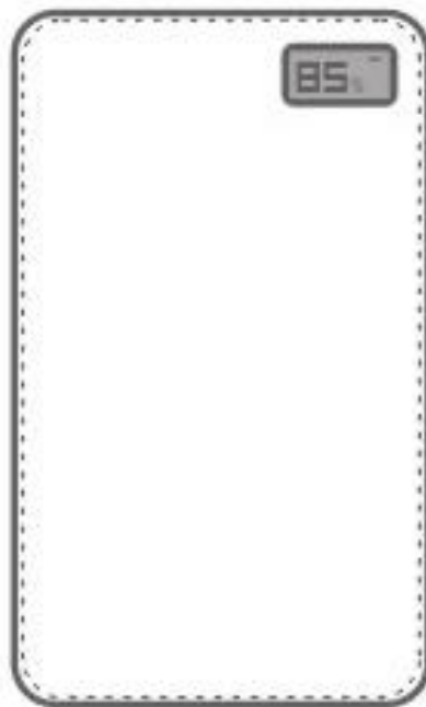
Diagramme du T132