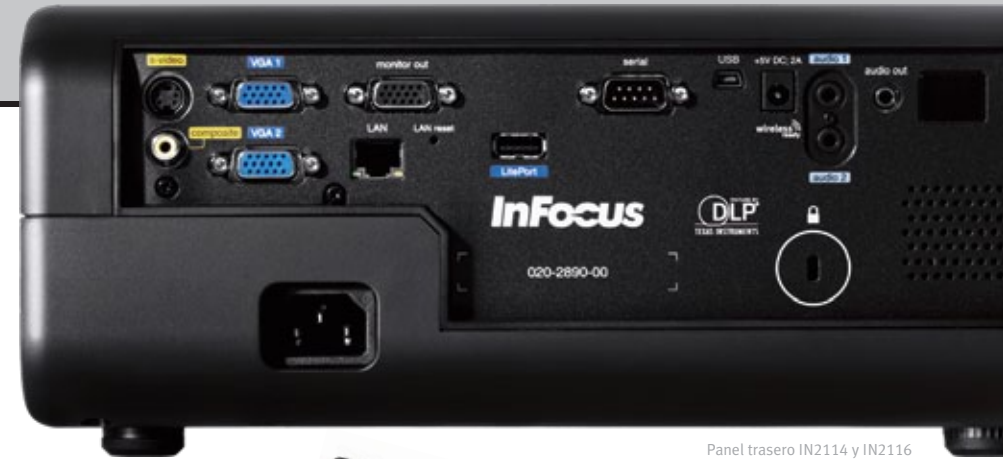
Panel trasero IN2114 y IN2116