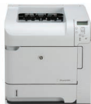
Impresora HP LaserJet P4014