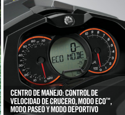
CENTRO DE MANEJO: CONTROL DE VELOCIDAD DE CRUCERO, MODO ECO™, MODO PASEO Y MODO DEPORTIVO