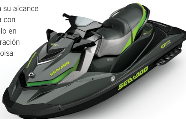
NUEVO color gris Anthracite y verde Manta

Esta distinguida moto acuática pone a su alcance diversión ilimitada para toda la familia con prestaciones exclusivas disponibles sólo en nuestro paquete Limited. Incluye coloración premium, VTS™ de alto desempeño, bolsa seca removible par almacenamiento, cubierta de la moto. Además, se beneficiará del exclusivo sistema inteligente iBR™ de freno y marcha atrás.