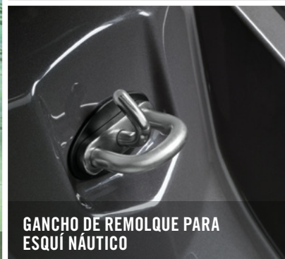
GANCHO DE REMOLQUE PARA ESQUÍ NAÚTICO