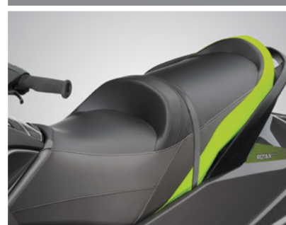
ASIENTO DE PASEO