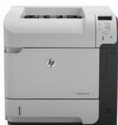
HP LaserJet Enterprise 600 M601dn