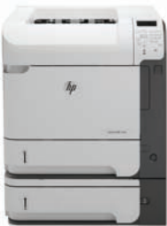
HP LaserJet Enterprise 600 M602x