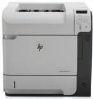
HP LaserJet Enterprise 600 M602n