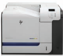
HP LaserJet Enterprise 500 color M551n