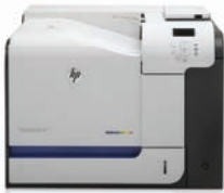
HP LaserJet Enterprise 500 color M551dn