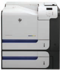
HP LaserJet Enterprise 500 color M551xh