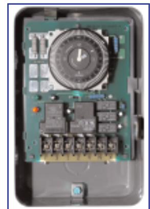
Caja del Reloj Figura 1

True Manufacturing recomienda 3 ciclos de descongelación diarios, con duración de 30 minutos.