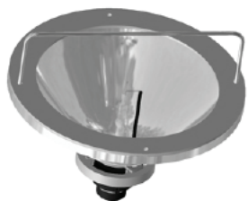
BULB REMOVAL TOOL