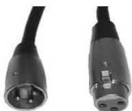
1). Figure 1

L'unità ed il controller DMX necessitano di connettore XLR a 3 pin standard per i dati di input e output dei dati (Figura