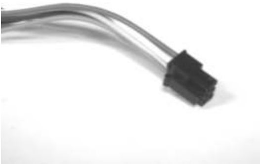
Figura 4 – Particolare - Connettore 6 PIN