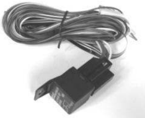
Figura 3 - Cavo di connessione