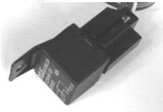
Figura 5 - Particolare - Relais