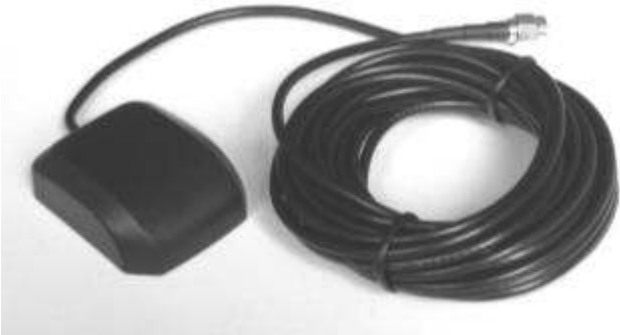
Figura 1 - Antenna GPS - 5 metri