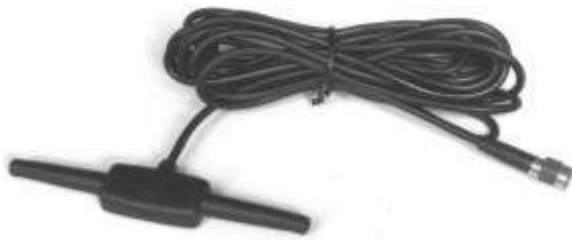
Figura 2 - GSM Antenna - 3 metri