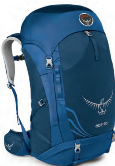
ACE 50 [età 8-14*]