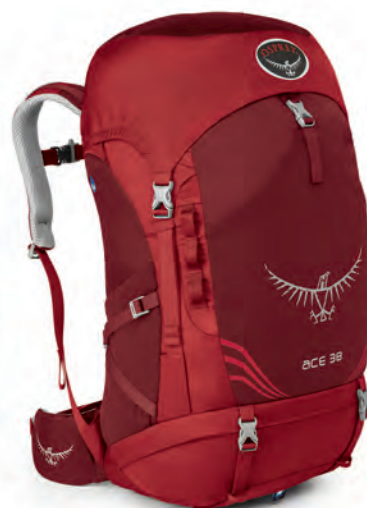
ACE 38 [età 6-11*]

La serie ACE consiste di zaini tecnici per giovani appassionati della natura, di età compresa tra 10 e 17 anni, con le stesse caratteristiche e lo stesso taglio degli zaini Osprey per adulti. Un busto regolabile e una cintura da vita permettono allo zaino di adattarsi alla taglia dell'utilizzatore, offrendo valore e comfort per tanti anni. L'Ace 75 offre capienza e funzionalità adatte ai gruppi di formazione all'aperto.