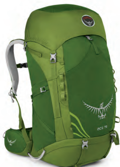
ACE 75 [età 11-18*]