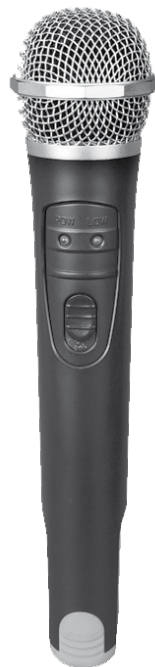
Microfono palmare SET 7020