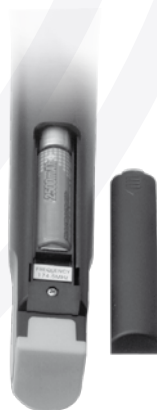
Esempio di inserimento batteria nel palmare del mod. SET 7020