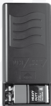
Esempio di inserimento batteria nel lavalier del mod. SET 7020LAV

Una volta completati questi passaggi siete pronti per utilizzare il vostro nuovo apparecchio.