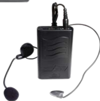
Microfono lavalier SET 7020LAV