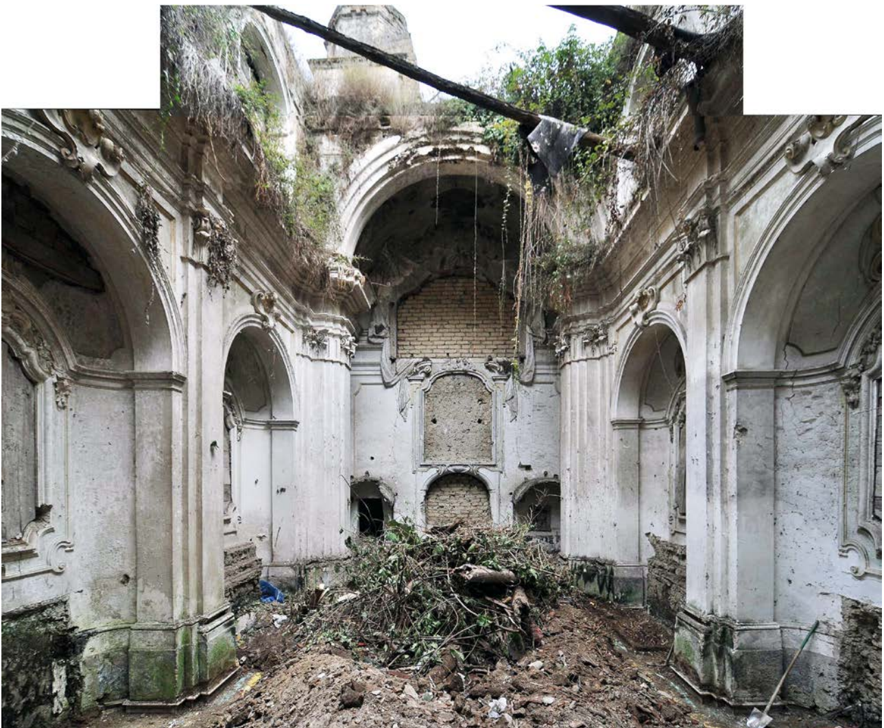
Fig.3: La navata dall'ingresso, foto dell' Ottobre 2010

Gli intonaci sono presumibilmente in cattivo stato, mentre lo strato pittorico risulta praticamente assente e presso che irriconoscibile nei colori originari. Il vano superiore in corrispondenza della prima stanza, coperto a volta, ha pavimento e soffittatura crollati (ed è quindi del tutto inaccessibile). La scaletta di accesso a questo vano, a travi e scalini in legno, è crollata e non esiste attualmente (a meno di un pezzo di rampante finale).