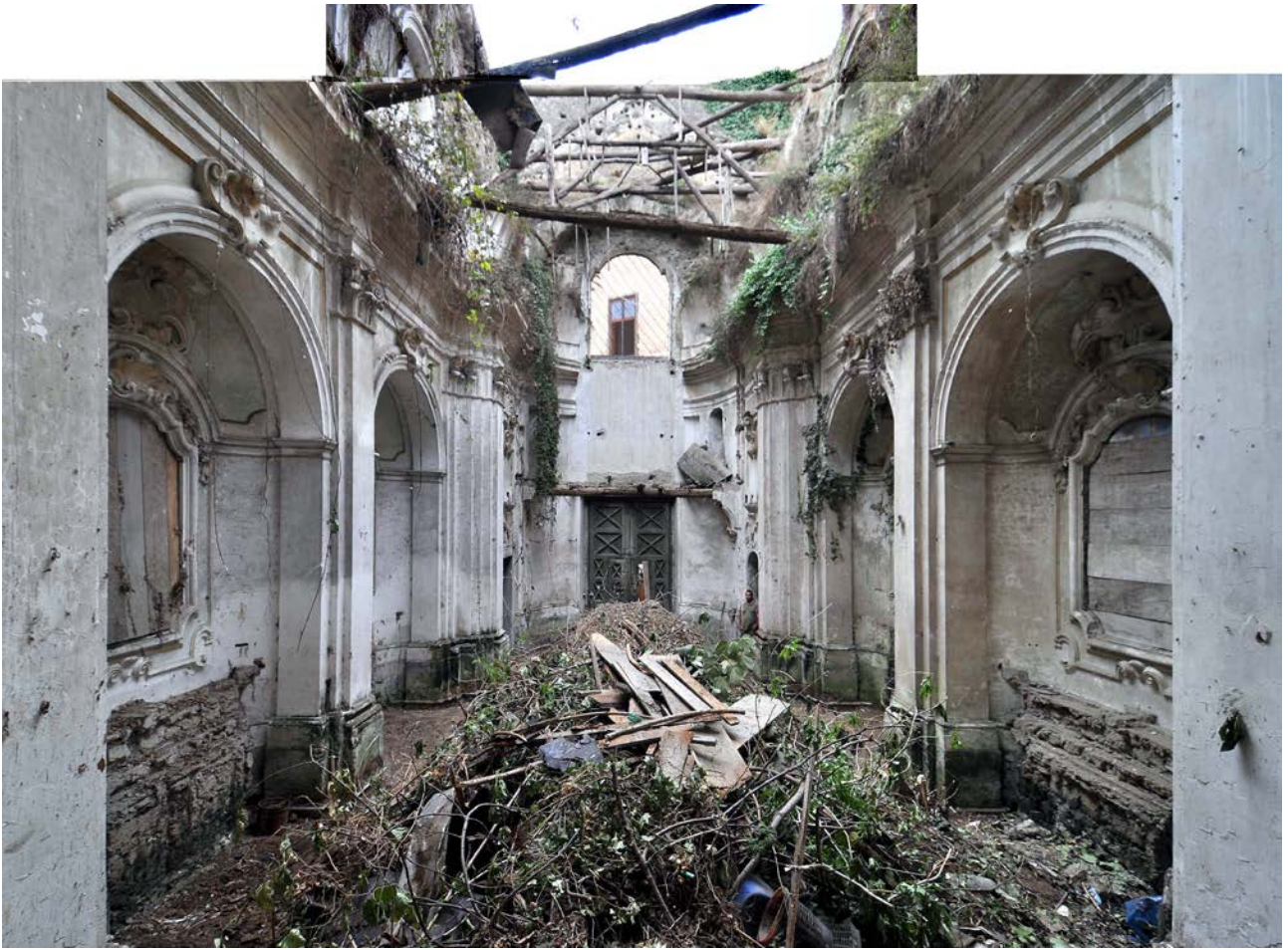
Fig. 4: La navata, controcampo dall'abside dell'altare, foto dell' Ottobre 2010